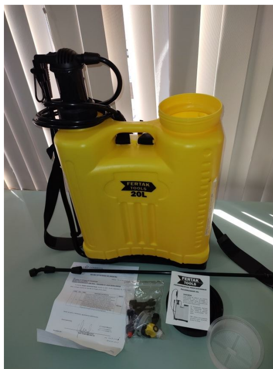
Figura 1 – (A) Vista Pulverizador Costal adaptação e documentos descritivos;