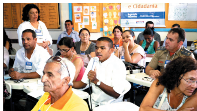
Participação popular na apresentação de propostas