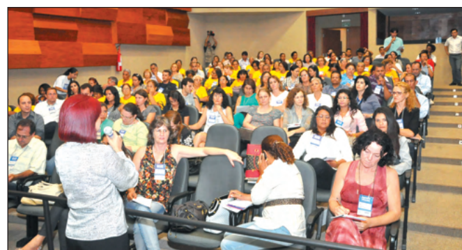
Audatório do Sesc (Palmas) lotado por um dos grupos temáticos