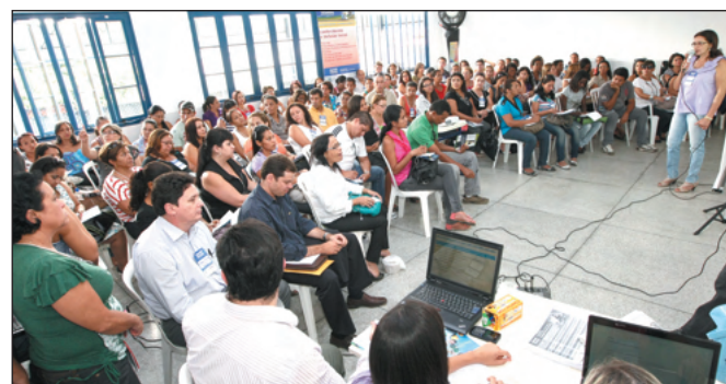
Sala lotada de populares e técnicos para discutir propostas