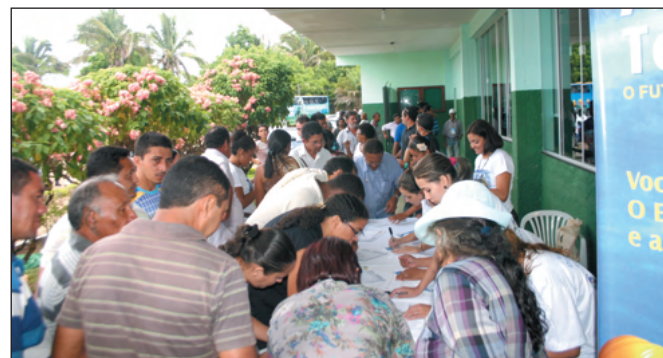
Público se inscreve para participar de mais um fórum