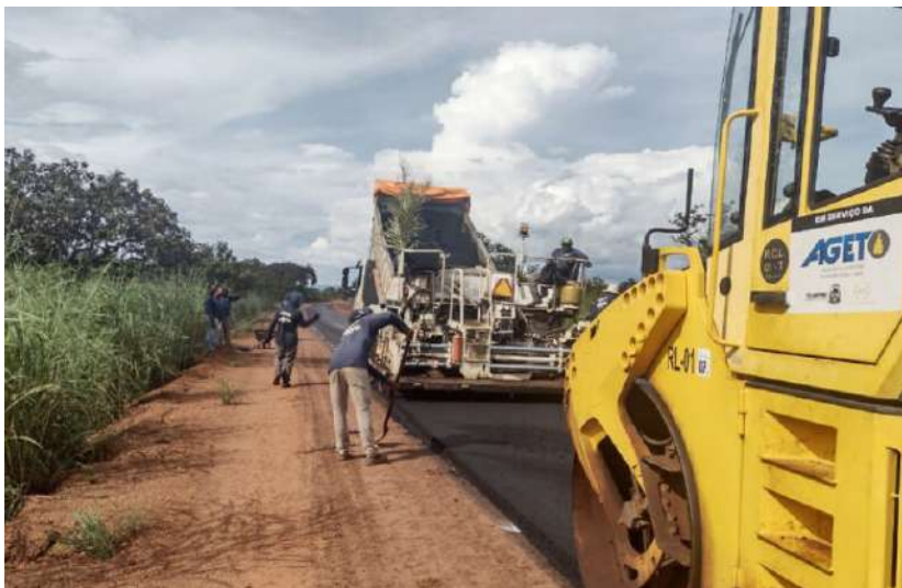
Trecho – TO-348 – Entr. TO-080 (Luzimangues)/Barrolândia