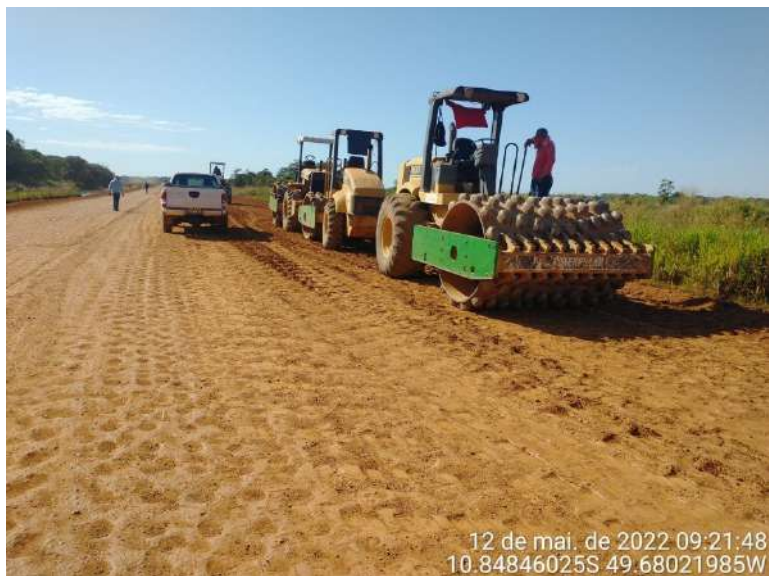
Trecho – TO-255 – Lagoa da Confusão / Barreira da Cruz