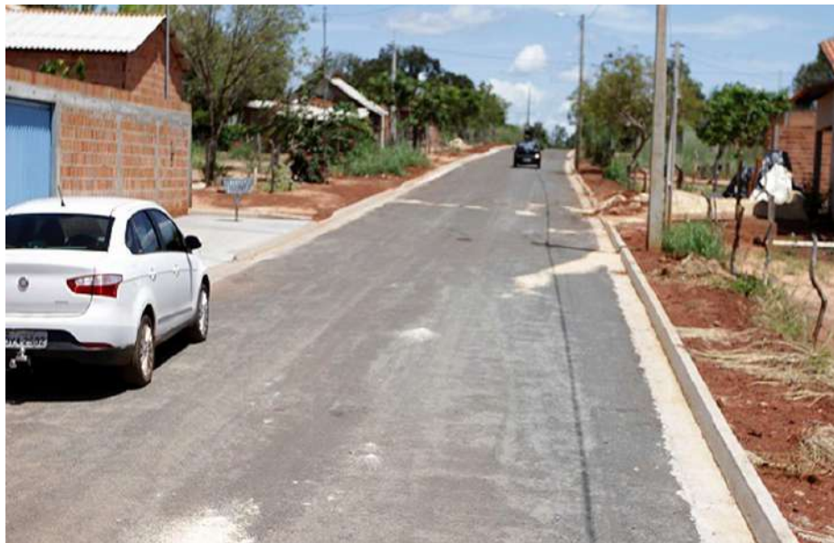
✓ Sítio Novo do Tocantins