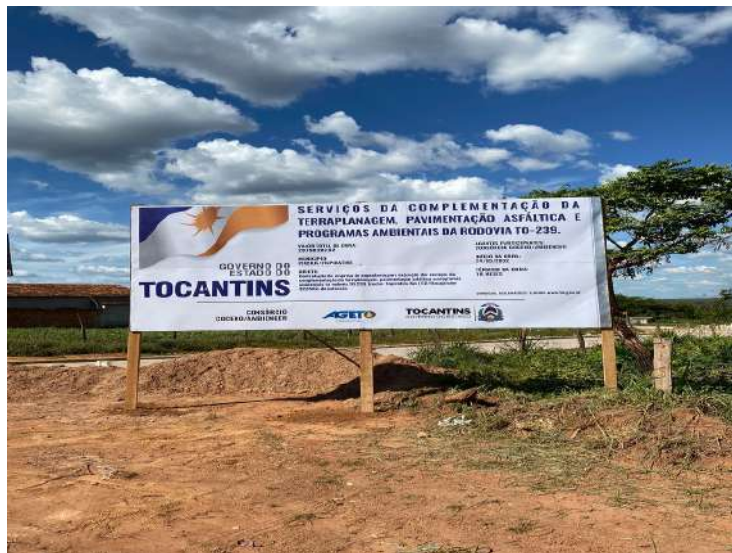
Trecho – TO-239 - Itacajá – Itapiratins REGIONAL MEIO NORTE