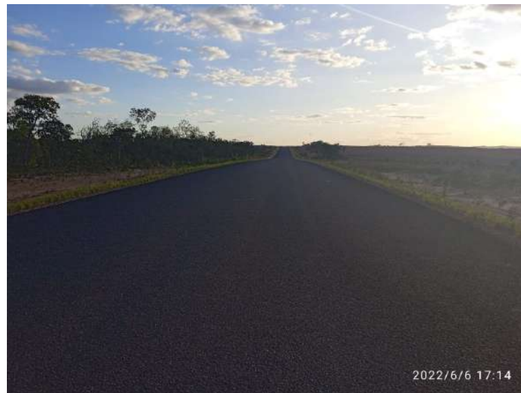
Trecho - TO-247 – Lagoa do Tocantins / Entroc.