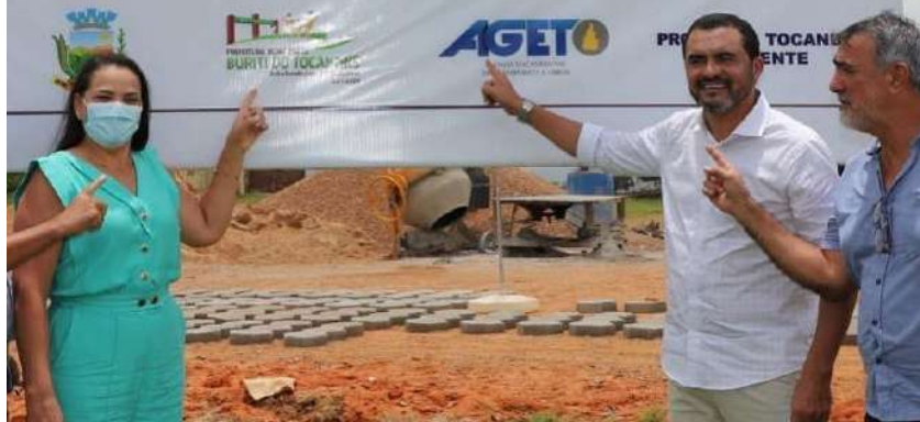
✓ Buriti do Tocantins

EMPRESA: J.K.S. ALVES E CIA LTDA CNPJ: 14.092.200/0001-26 CONTRATO Nº: 17/2022 VALOR: R$ 2.001.360,78 PRAZO: 180 DIAS