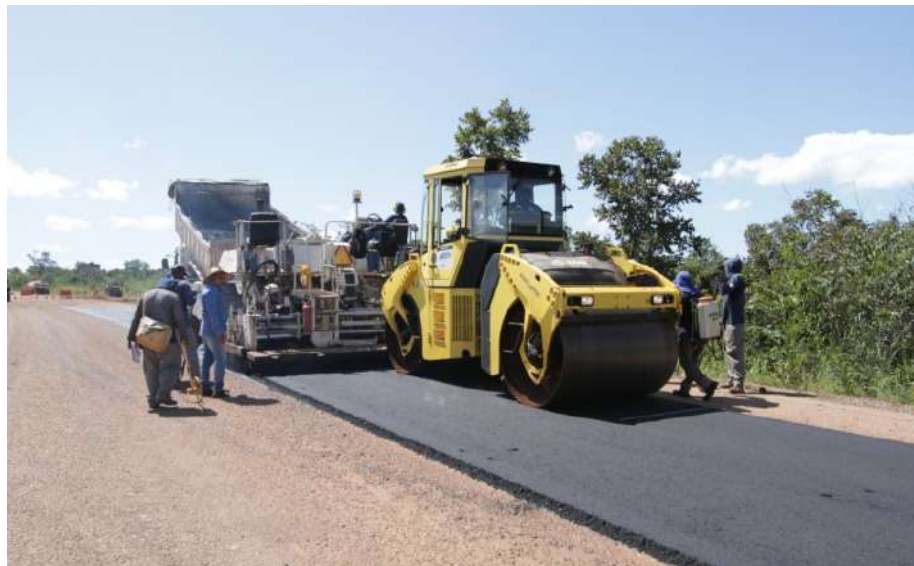
Trecho – Araguatins – São Sebastião do Tocantins REGIONAL BICO DO PAPAGAIO