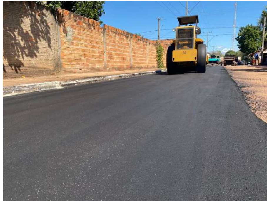
✓ Lagoa do Tocantins