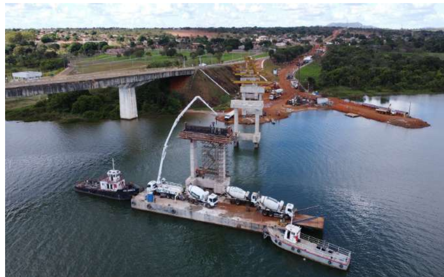
Trecho – Ponte de Ligamento da TO-050 – Porto Nacional / TO 255 sentido BR-153