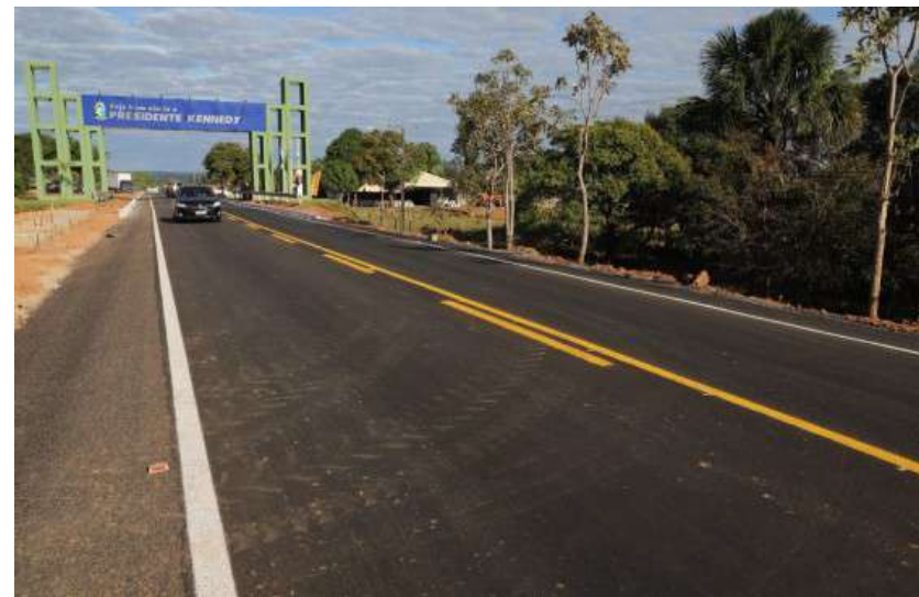
Trecho – TO-239 – BR-153 – Presidente Kennedy REGIONAL MEIO NORTE