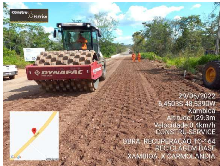
Trecho – TO-164 – Xambioá - Carmolândia REGIONAL NORTE ARAGUAÍNA