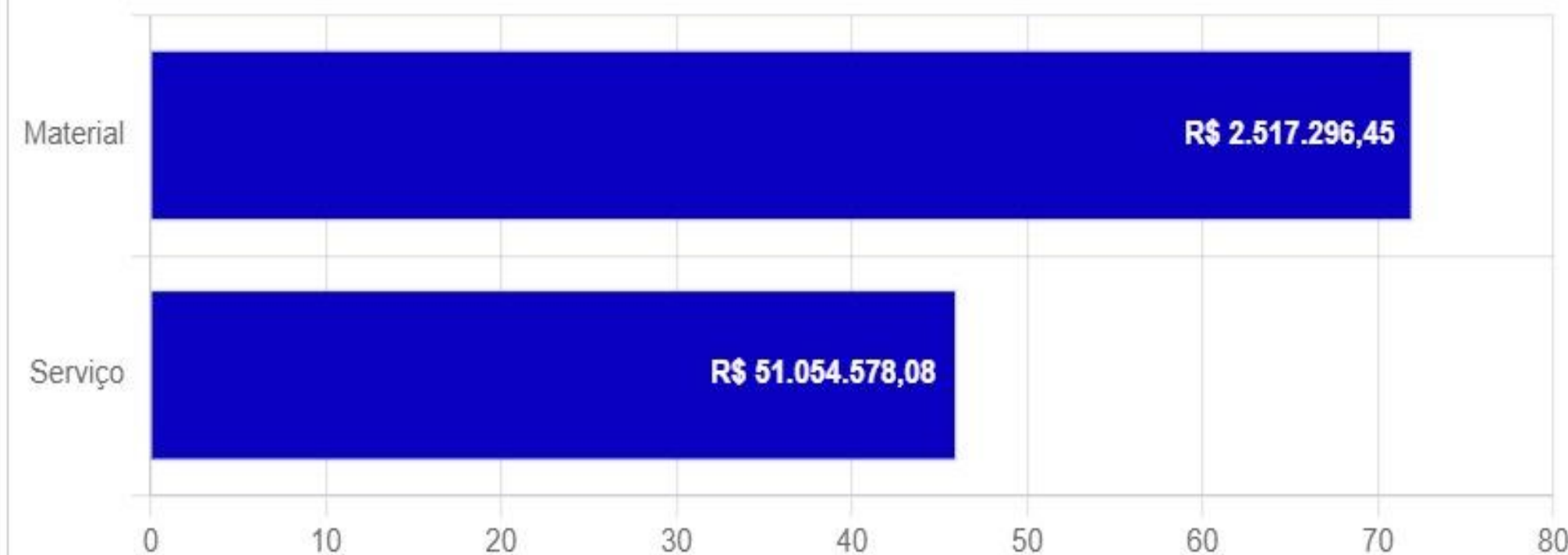
Valor Total Estimado e Qtde de itens por Categoria

Valor Total estimado (R$): R$ 53.571.874,53