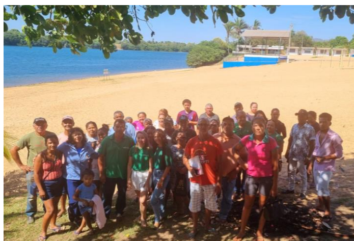
Figura 2. Reunião na Colônia de Pescadores de Palmeirante Z-36, Palmeirante - TO.

Espera-se também que este informativo possa sensibilizar gestores locais, municipais e estaduais sobre a relevância da cadeia produtiva da pesca artesanal, destacando os impactos econômicos e sociais dessa atividade. Ao fornecer uma base sólida de dados, o projeto pode colaborar na formulação e ajuste de políticas públicas mais eficientes, como o estabelecimento de uma estatística pesqueira contínua e de qualidade. Isso permitirá um acompanhamento mais preciso da pesca artesanal, promovendo ações que fortaleçam o setor e garantam sua sustentabilidade a longo prazo.