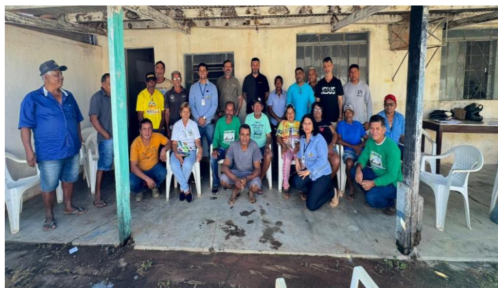
Figura 2. Reunião na Colônia de Pescadores de Miracema Z-16, em Miracema do Tocantins - TO.

Espera-se também que este informativo possa sensibilizar gestores locais, municipais e estaduais sobre a relevância da cadeia produtiva da pesca artesanal, destacando os impactos econômicos e sociais dessa atividade. Ao fornecer uma base sólida de dados, o projeto pode colaborar na formulação e ajuste de políticas públicas mais eficientes, como o estabelecimento de uma estatística pesqueira contínua e de qualidade. Isso permitirá um acompanhamento mais preciso da pesca artesanal, promovendo ações que fortaleçam o setor e garantam sua sustentabilidade a longo prazo.