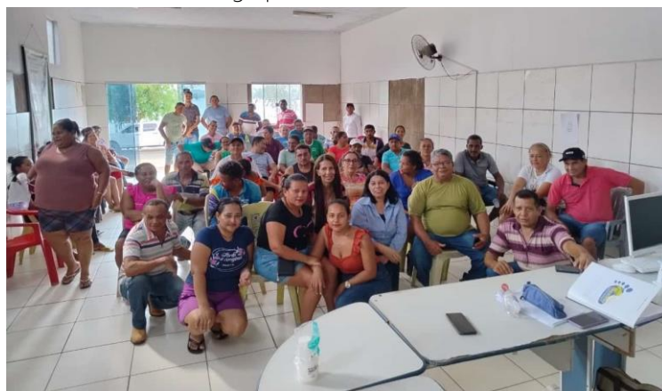
Figura 2. Reunião dos associados da Colônia de Pescadores do Estado do Tocantins Z-33, em Xambioá- TO.

Espera-se também que este informativo possa sensibilizar gestores locais, municipais e estaduais sobre a relevância da cadeia produtiva da pesca artesanal, destacando os impactos econômicos e sociais dessa atividade. Ao fornecer uma base sólida de dados, o projeto pode colaborar na formulação e ajuste de políticas públicas mais eficientes, como o estabelecimento de uma estatística pesqueira contínua e de qualidade. Isso permitirá um acompanhamento mais preciso da pesca artesanal, promovendo ações que fortaleçam o setor e garantam sua sustentabilidade a longo prazo.