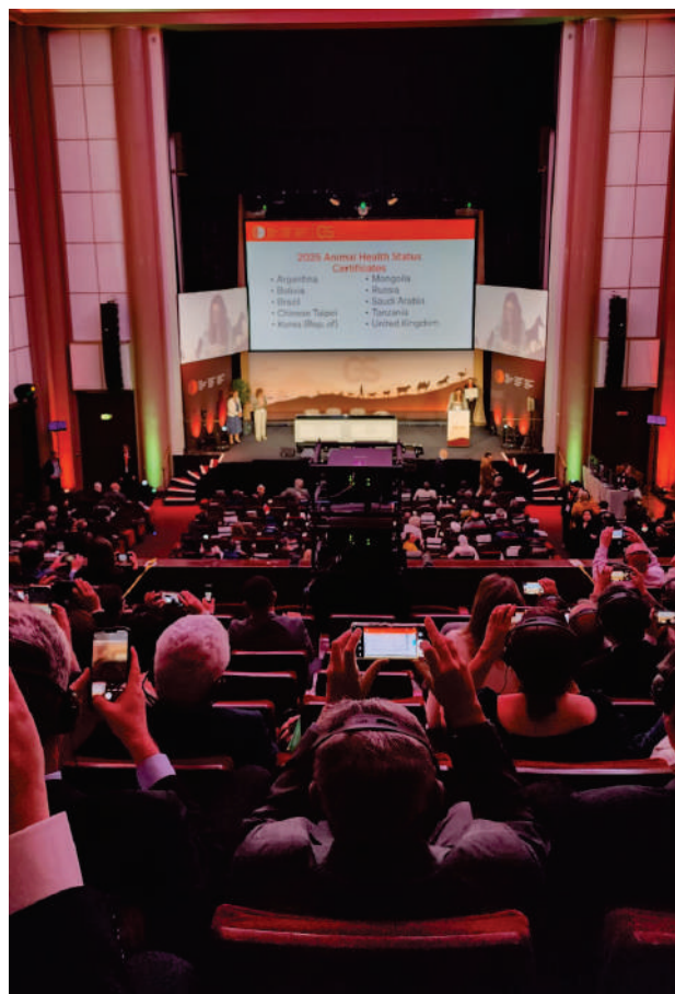
Representantes da Adapec e da Seagro na 92ª Sessão Geral da WOAHS, em Paris, onde o Tocantins recebeu o certificado de área livre de febre aftosa sem vacinação

A partir de agora, as ações de vigilâncias do rebanho são voltadas a comprovar a ausência do vírus no Estado.